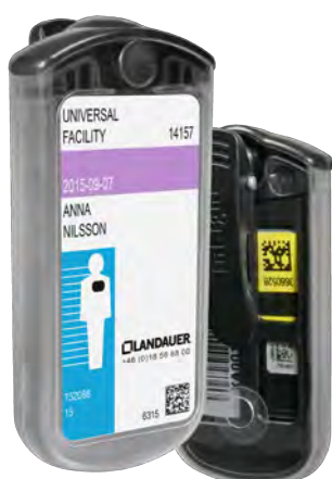
InLight® med integrerad NEUTRAK

LANDAUER tillhandahåller en tjänst för persondosimetri. Denna tjänst används främst av personal som i sitt dagliga arbete riskerar att utsättas för joniserande strålning.